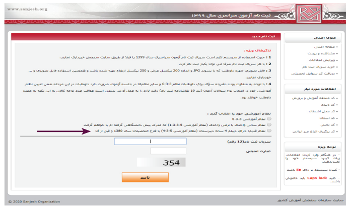
(تصویر شماره یک)

این داوطلبان بعد از بارگیری عکس و تأیید، وارد محیط تقاضانامه شده و لازم است نسبت به تکمیل بندهای تقاضانامه ثبت‌نام اقدام نمایند.