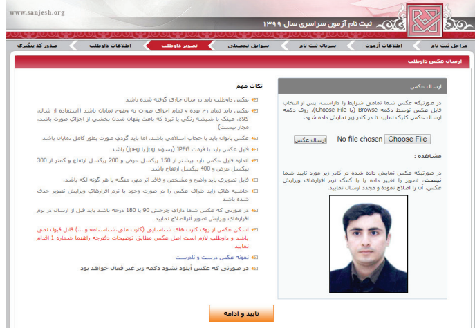
(تصویر شماره چهار)

کلیه داوطلبان حالت‌های اول تا سوم پس از تکمیل تقاضانامه ثبت‌نام لازم است نسبت به پرینت تقاضانامه تکمیل شده که حاوی اطلاعات داوطلب و همچنین شماره پرونده ۷ رقمی و کد پیگیری ثبت‌نام ۱۶ رقمی می‌باشد اقدام نمایند.