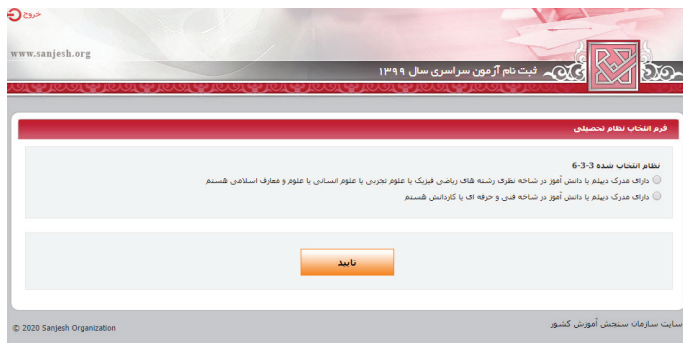
(تصویر شماره دو)

➤ آن دسته از داوطلبان نظام جدید ۳-۳-۶ که (مطابق تصویر شماره ۲) بند مربوط به «دانش آموز شاخه نظری رشته‌های ریاضی فیزیک، علوم تجربی، علوم انسانی و علوم معارف اسلامی هستیم» را علامت‌گذاری می‌نمایند وارد محیط دریافت کد سوابق تحصیلی و مشاهده مشخصات شناسنامه‌ای می‌شوند که پس از مشاهده و تأیید اطلاعات، این داوطلبان وارد صفحه بارگذاری عکس (تصویر شماره ۴) شده و پس از بارگذاری و تأیید عکس وارد محیط تقاضانامه ثبت‌نامی می‌شوند.