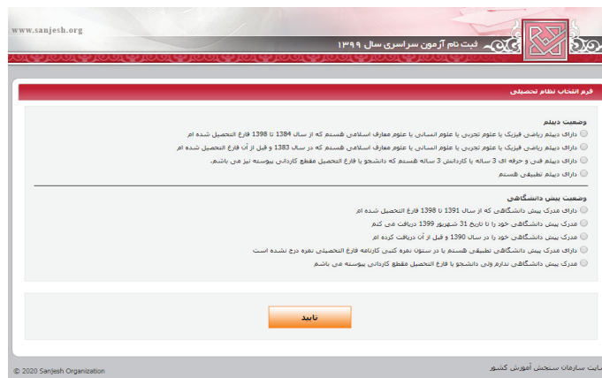
(تصویر شماره سه)

➤ داوطلبان لازم است با توجه به سال اخذ دیپلم و یا پیش‌دانشگاهی و یا مدرک کاردانی، نسبت به علامتگذاری موارد مندرج در این صفحه اقدام نموده که در این صورت داوطلبان با توجه به نوع علامتگذاری بندها، کسانی که مشمول سوابق تحصیلی هستند با ورود کد سوابق تحصیلی و کد دانش‌آموزی و سپس مشاهده سوابق تحصیلی خود اقدام نمایند. این داوطلبان پس از تأیید سوابق تحصیلی وارد صفحه بارگذاری عکس (تصویر شماره ۴) شده و پس از بارگذاری وارد محیط تقاضانامه ثبت‌نامی شده و نسبت به تکمیل بندهای مورد نیاز اقدام نمایند. ➤ برخی از داوطلبان نیز که مشمول سوابق تحصیلی نمی‌باشند، وارد صفحه بارگذاری عکس (تصویر شماره ۴) شده و پس از بارگذاری و تأیید عکس وارد محیط تقاضانامه ثبت‌نامی می‌شوند.