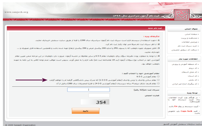
(تصویر شماره یک)

➤ داوطلبانی که نظام سالی واحدی یا ترمی واحدی را در تصویر یک به شرح ذیل انتخاب می‌نمایند وارد محیط فرم انتخاب نظام تحصیلی خواهند شد. (مطابق تصویر شماره ۳)